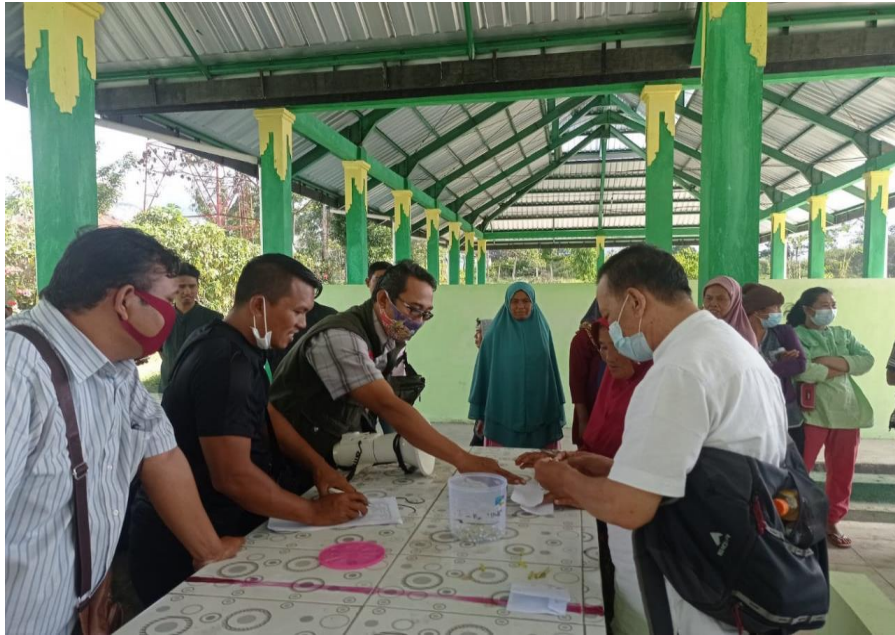
Kegiatan Pembagian/lot untuk penempatan berjualan di Los Pasar Sembalun